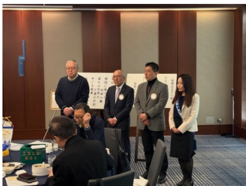
3月のお誕生日、結婚記念日の皆さん おめでとうございます！