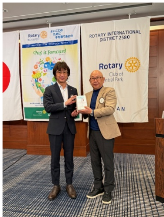
1月度皆出席表彰3年 安富会員