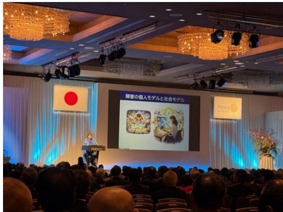
2月26日 ホテルニュータニ東京にて 国際ロータリー第2580地区 地区大会開催