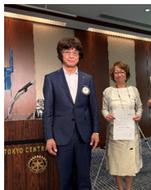
13 年皆出席表彰の萱森会員