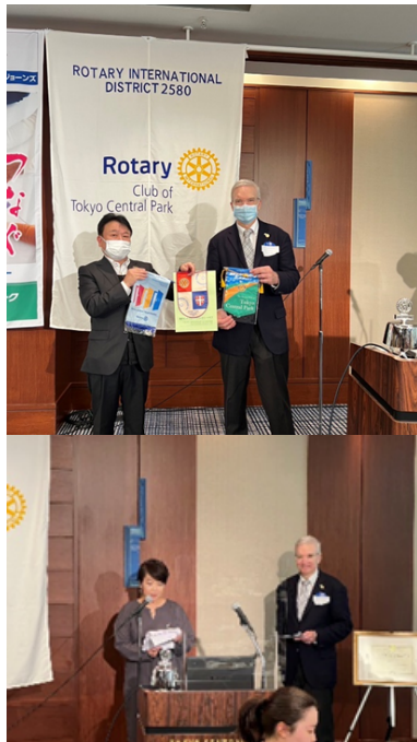
ピッコリ氏と榛村会長のバナー交換とご挨拶