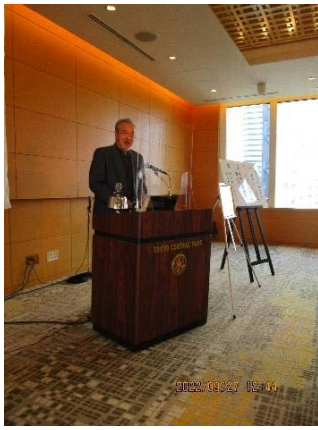
安田ロータリー財団委員長

9/17「地区ロータリー財団セミナー」へ参加報告 11月「ロータリー財団月間」に因み、自クラブで 財団セミナーの卓話をするようにとの事で卓話を 予定しています。