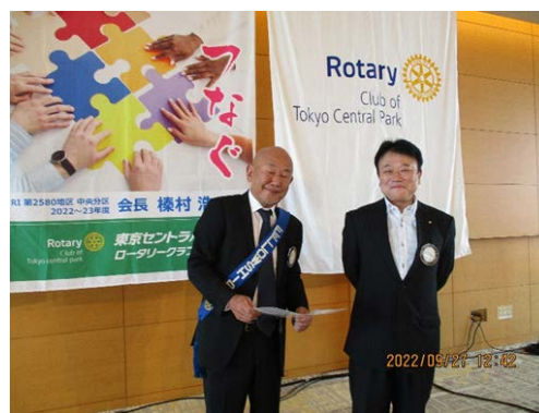
8月度ニコニコ大賞の安富会員