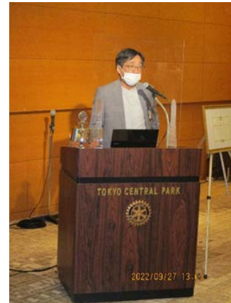
「ロータリーのお勉強」