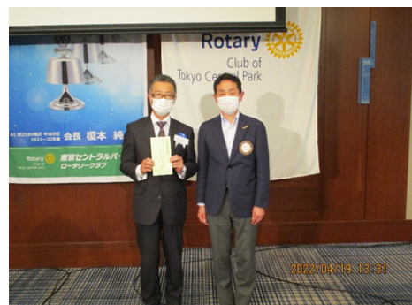
ロータリー希望の風奨学金へ支援金の贈呈