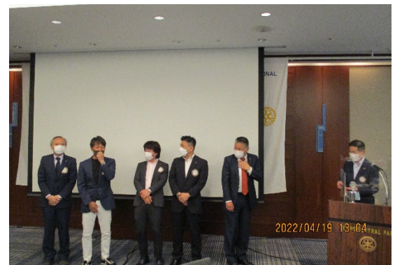
ポール・ハリス・フェローとなられた河東会員 花形会員、小野会員、杉本会員、深谷会員