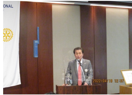
古川実行委員長より、創立40周年記念式典現在の進行状況に関して説明がありました