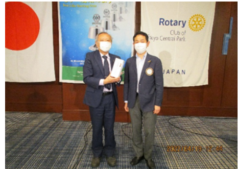
3月 皆出席表彰3年の河東会員