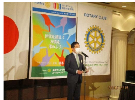
榎本会長エレクトより次年度の理事役員の紹介