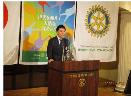
橋本会長より最終夜間例会の挨拶と参加されたご家族の紹介がありました