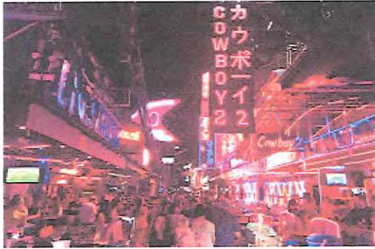
バンコクでのお楽しみ ②