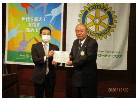
11月ニコニコ大賞の白石会員