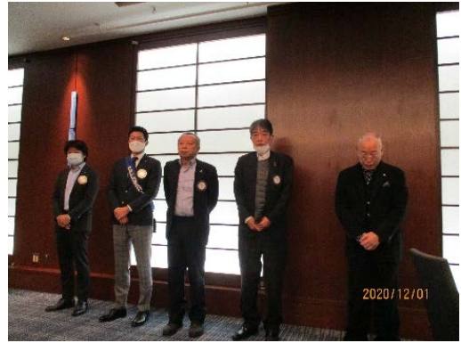
12 月のお誕生日・結婚記念日皆さん おめでとうございます