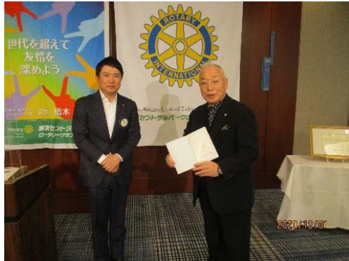
古内会員へポール・ハリス・ソサエティと 米山功労者の表彰状の授与