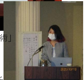
「生きる力・整理収納術」