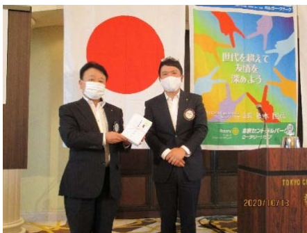
9月皆出席表彰の榛村会員