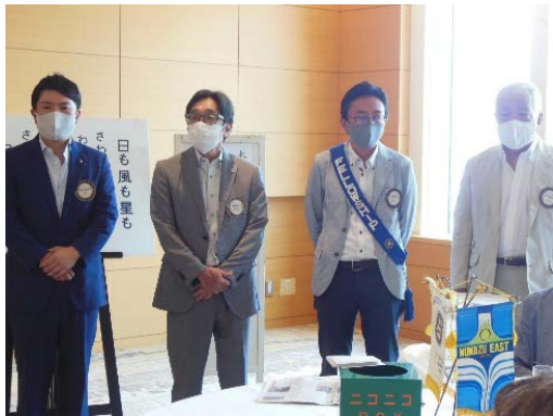
8月のお誕生日・結婚記念日の皆さん おめでとうございます！