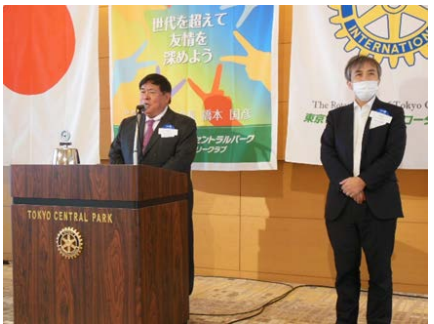
兄弟クラブの練馬西 RC 横山会長・本橋幹事