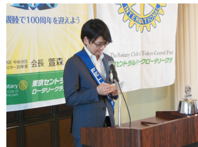
中嶋会員によるニコニコBOXの