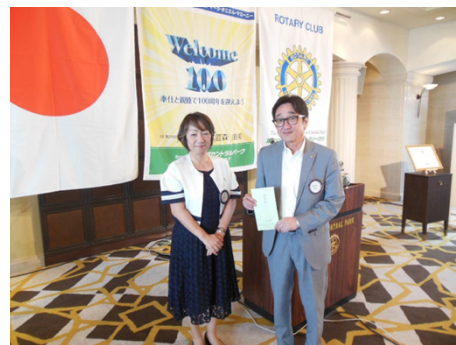
阿佐谷ジャズへ協賛