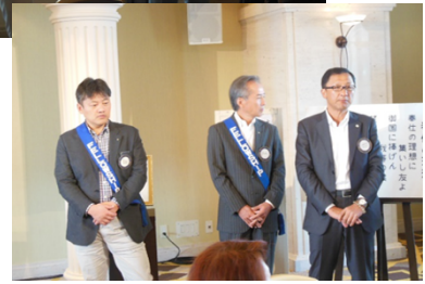
10月のお誕生日、結婚記念日の皆さま