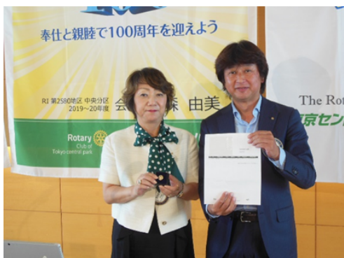
PHF + 1 の萱森会長