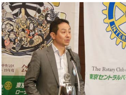
榎本会員よりTV放映に関連し 内尾会員の話がありました