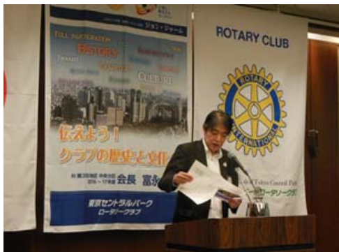
富永会長の新年の挨拶