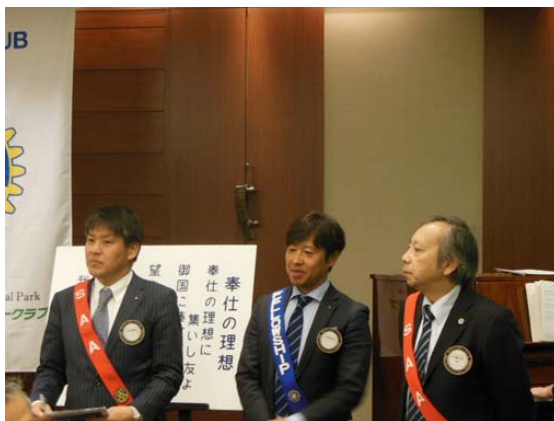
1 月の結婚記念日、お誕生日の皆さん