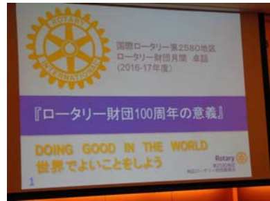
「ロータリー財団 100 周年の意義」 地区補助金委員会 委員 松林 茂会員 (卓話内容は別紙掲載)