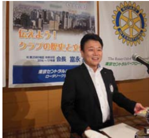
榛村社会奉仕委員長

東京中野 RC として 30 年、東京セントラルパーク RC として 5 年目になります。30 周年記念例会でいただいたチャーターメンバーであります北條先生の「きし方、行く末の狭間に佇んで」という卓話をいただき、その文章の中で「名称変更」について苦悩されたお心を感じております。ぜひ記念例会を成功したいと思っております。会員の皆様ご協力よろしく申し上げます。ありがとうございました。今年 1 年よろしく申し上げます。