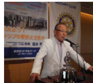
古内職業奉仕委員長

クラブ奉仕で重要なことは親睦につきると思います。始めに親睦が有り職業奉仕、社会奉仕、国際奉仕とつながり親睦活動がすべての出発であると思います。楽しい例会を心がけ年間を通し各同好会(映画、ワイン、ゴルフ、酒粋会)と会員同氏の親睦と絆を深めることで、例会の出席率向上会員増強、退会防止、奉仕活動の充実とより魅力的クラブへ発展させる礎となって行きたいと思います。会員の皆様今年一年宜しく願い致します。