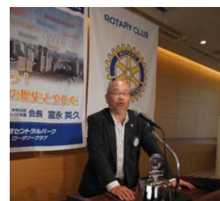
松林国際奉仕委員長

4.ライラ(RYLA)は、ロータリー青少年指導者養成プログラムです。主に高校生大学生若い社会人が対象で、リーダーシップ研修やコミュニケーション等のワークショップや活動を行っています。まだ、当地区ではまだ未活動ですが、委員会も立ち上がったようですので、今後活動していくかもしれません。