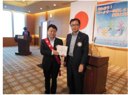
皆出席表彰5年の榛村会員。