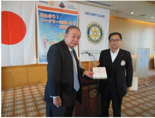
皆出席表彰 6年の白石会員。