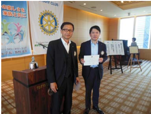
3月ニコニコ大賞の橋本会員。