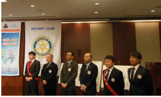
1月のお誕生日、結婚記念日の皆さん。