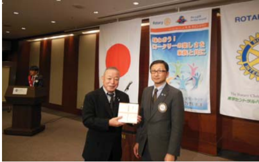
皆出席9年の古内会員。