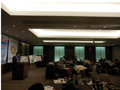
おせち料理を頂ながらの今年初の例会風景。