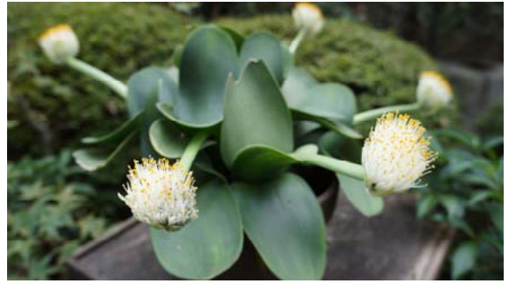
眉刷毛万年青 〈まゆはけおもと〉