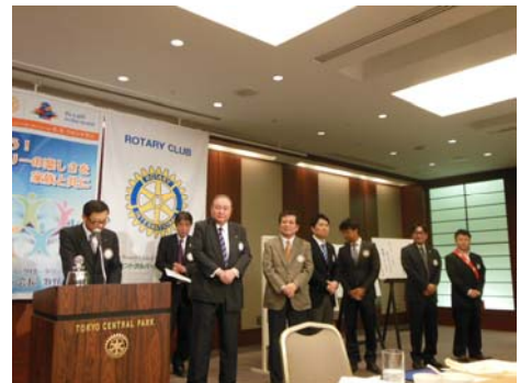
次年度理事・役員の方々