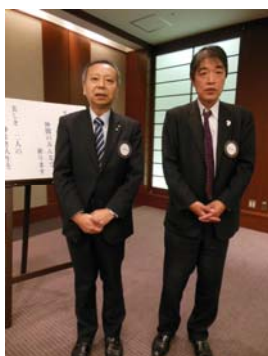
12 月お誕生日、結婚記念日の皆さんおめでとうございます。