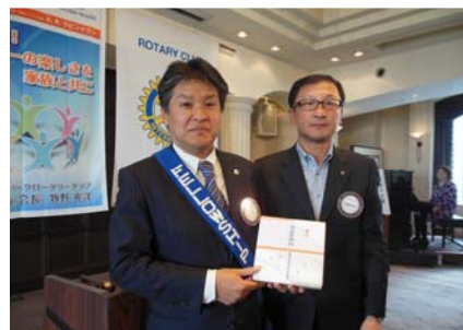
皆出席表彰 2年の深谷会員。