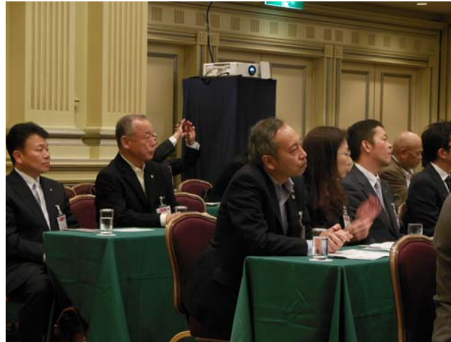
パネリストの活発な意見に真剣に聞き入る当クラブ会員。