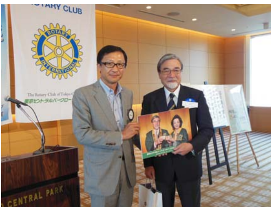
30 周年記念例会の時の櫻井よしこ氏と戸田 PG の写真を記念パネルにして。