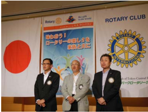
9 月ご夫人のお誕生日の皆さん