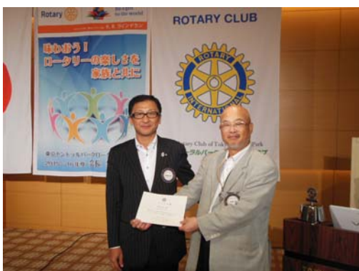
7 月度ニコニコ大賞の松林会員。