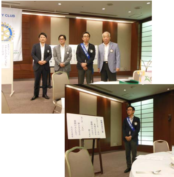
8 月のお誕生日、結婚記念日の皆さん おめでとうございます。