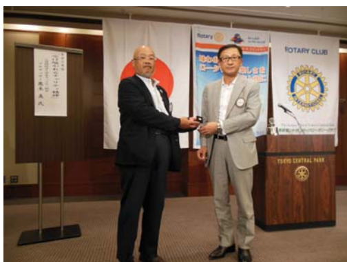
ポールハリスフェローピン+4 の 松林会員。