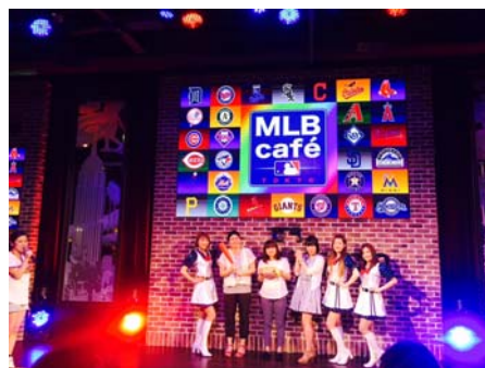
奨学生の皆で盛り上がりました。