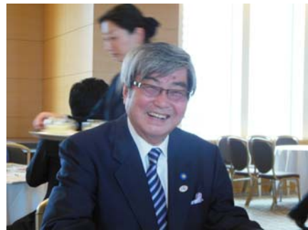
吉田地区拡大増強委員長をお迎えして。