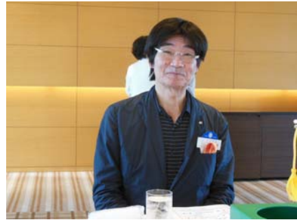
出村様、メーカー有難うございます。