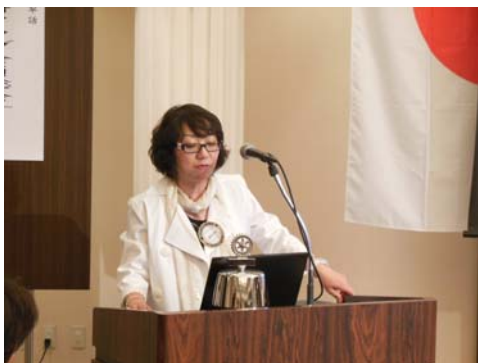
萱森会員より、地区大会のフォトDVDの映写。