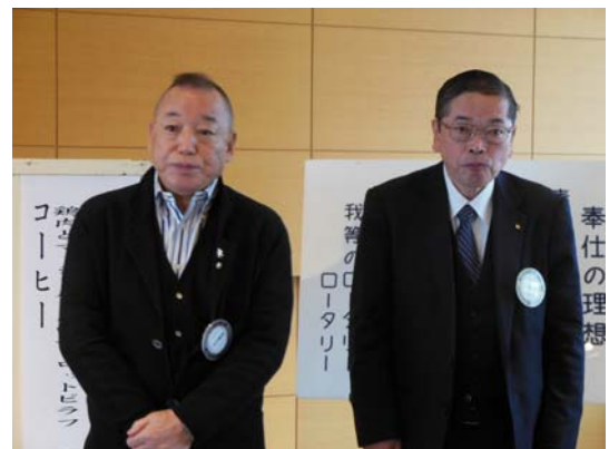
4月 結婚記念日のお二人。