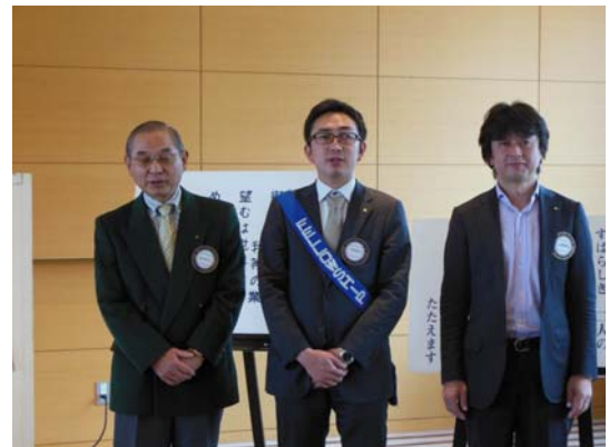
4月 お誕生日の皆さんです。