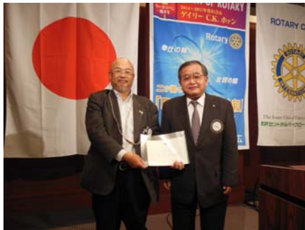
1 月度ニコニコ大賞の松林会員。