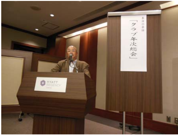
松林幹事の進行で クラブ年次総会が進められました。