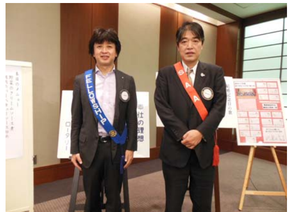
結婚記念日の小野会員と富永会員。