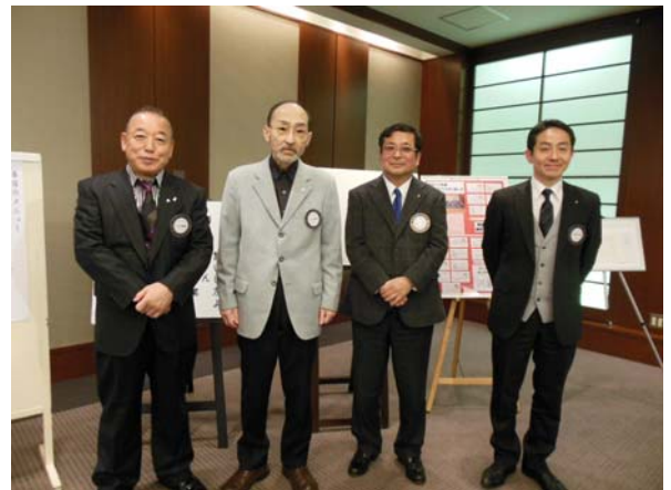
今月お誕生日の方々(ご夫人もふくめ)。