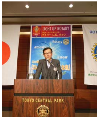
牧野次年度会長の挨拶。