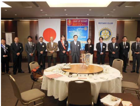
牧野次年度会長を中心に次年度理事の 各メンバーの紹介と挨拶がありました。