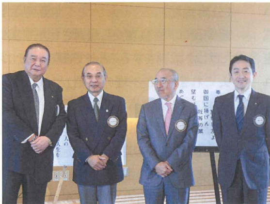
結婚記念日の皆さん おめでとうございます！！