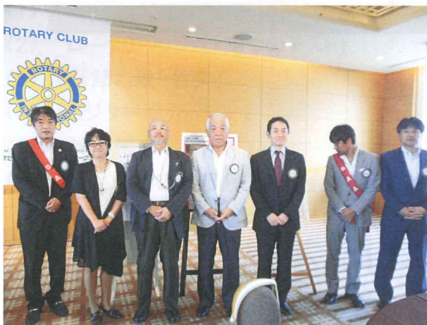
7月お誕生日の皆さん。