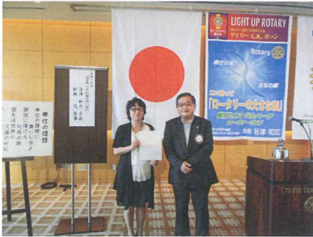
地区大会実行委員会幹事の萱森会員