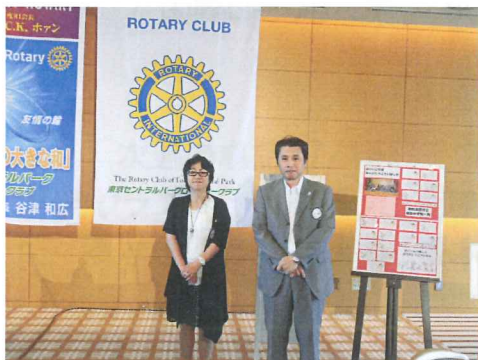
結婚記念日のお二方