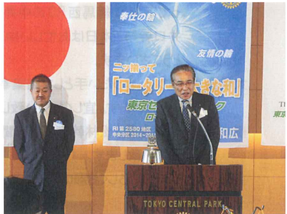
新年度のご挨拶にお見えの東京練馬西 RC 中井川会長様と井口幹事。